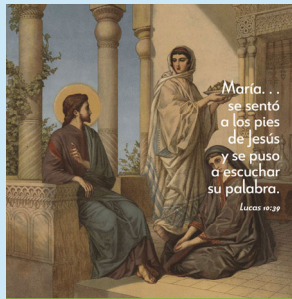
DECIMOSEXTO DOMINGO DEL TIEMPO ORDINARIO 17 DE JULIO DE 2022

¿Cómo podemos dar alegría y balance a nuestras vidas de oración y servicio a nuestro Dios amoroso? En el Evangelio de hoy, Jesús le dice a Marta que su preocupación por hacer lo correcto, como lo ordena la tradición judía, podría no ser el mejor uso de sus energías. Su hermana María, que atraída se sienta a los pies de Jesús, no debe ser reprendida.