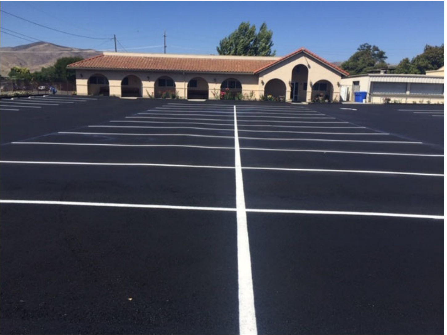
Construction of a new Parking Lot for the parishioners of “Our Lady of Solitude” in June of 2019. Cost:$130,090 Construcción de Estacionamiento para los Feligreses de,“Nuestra Señora de la Soledad” en junio 2019. Costo: $130,090