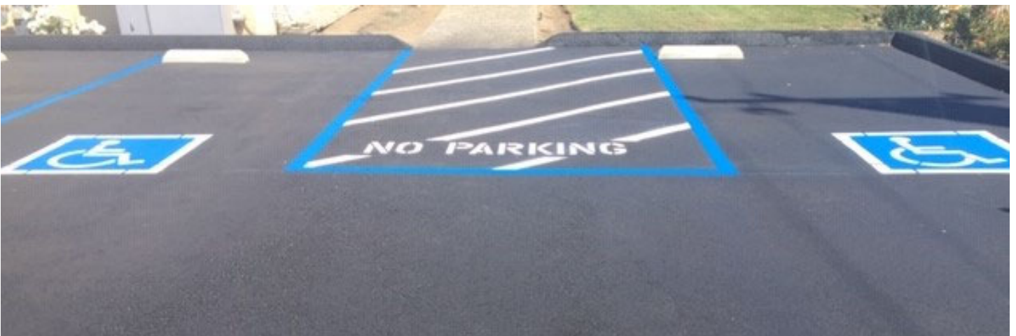
Spot for persons with special needs /Espacio para personas con necesidades especiales.